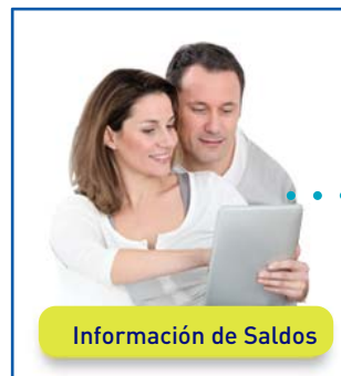
Información de Saldos

2. Consulta los últimos informes de Saldos